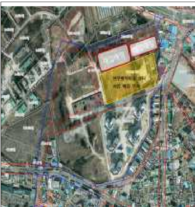
연무행복마을 쉼터(연무읍 안심리 일원)