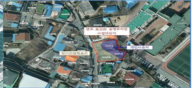
13. 연무읍 동산리 공영주차장 조성사업