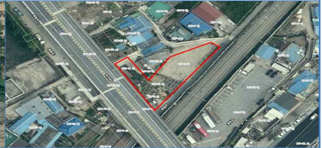
11-1. 부창동 178-1번지 공영주차장 조성사업