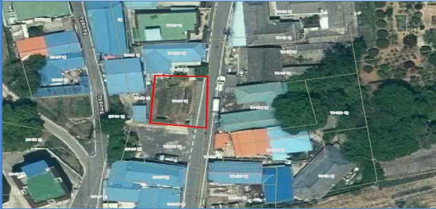
11. 연무읍 안심리 76-99