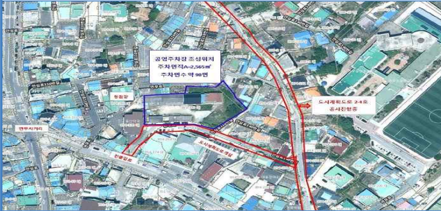
12. 연무읍 동산리 894-149 번지 공영주차장 조성사업