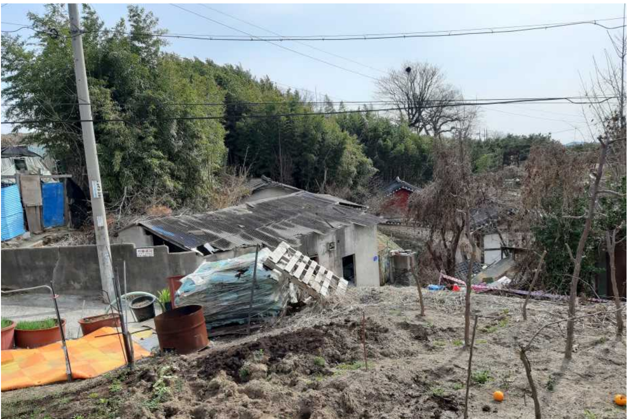
○ 죽림서원 옆 사유지 주택모습(소유주:배영희외1)