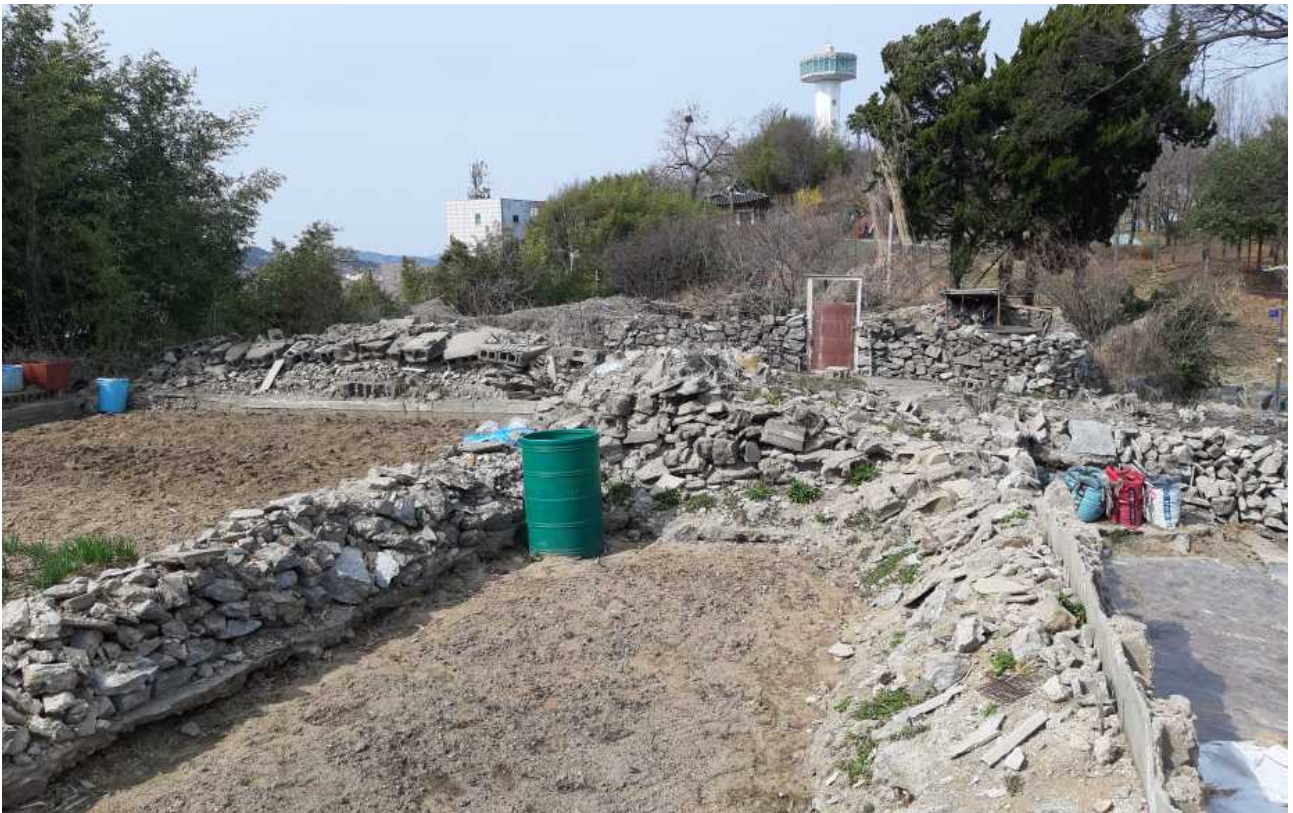
○ 죽림서원 뒤 부지에서 팔괘정이 보이는 모습