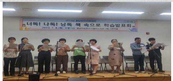
학습발표회 및 직업능력개발 연계