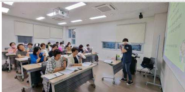
시민기본 소양교육 등