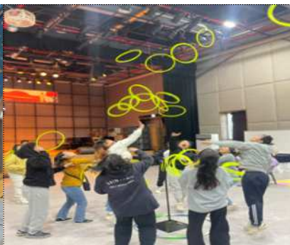
장애인 가족 힐링캠프