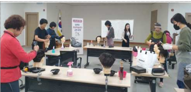
양촌면 평생학습센터 <이미용봉사자교육>

※ 지역별 평생학습매너저 선정·배치, 운영위원회 개최, 프로그램 개발·운영 등