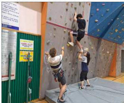
장애 유형별 맞춤 평생교육