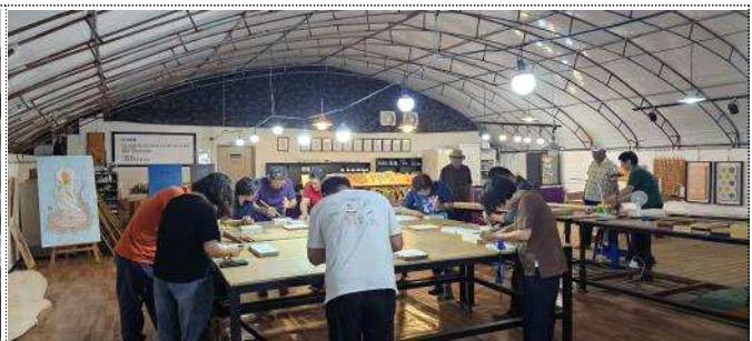
심암2리 마을배움터 <한마음서각교실>