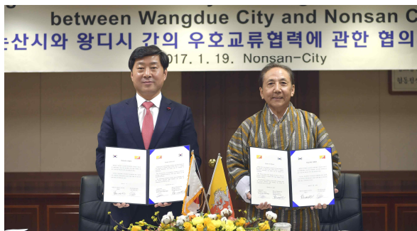
부탄공화국 가사시와 우호교류의향서 체결