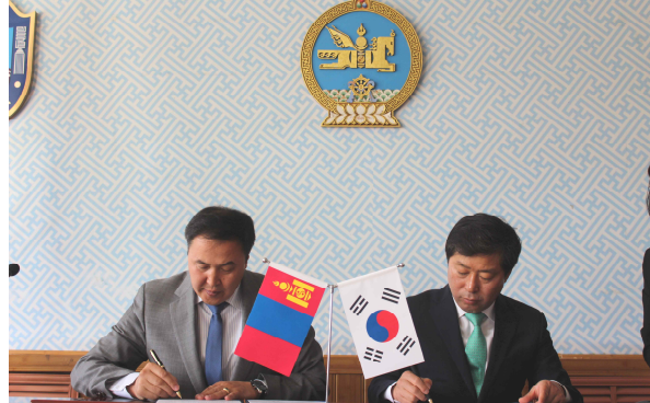
몽골 날라이흐구와 우호교류협정 체결