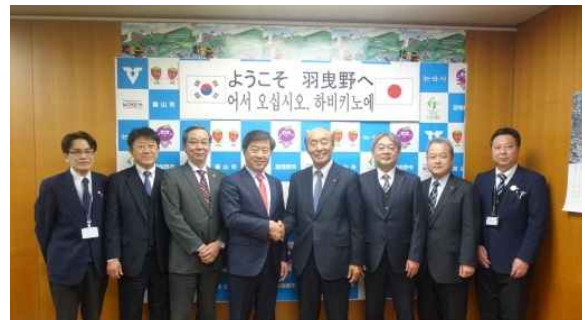
일본 하비키노시와 친선교류합의서 조인