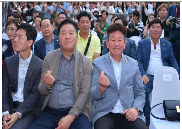
▲ 농식품 해외박람회 개막식 참석