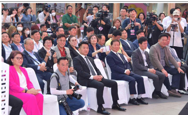
▲ 농식품 해외박람회 개막식 참석