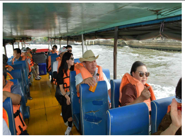
▲ 짜오프라야 강가 수상가옥 시찰