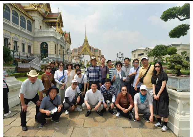
▲ 에메랄드 사원 방문