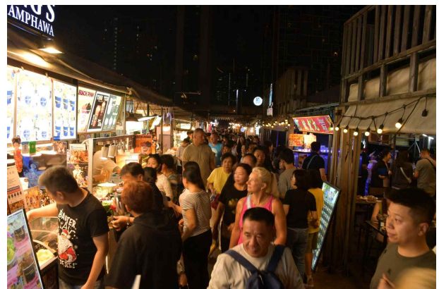
▲ 조드페어 시장