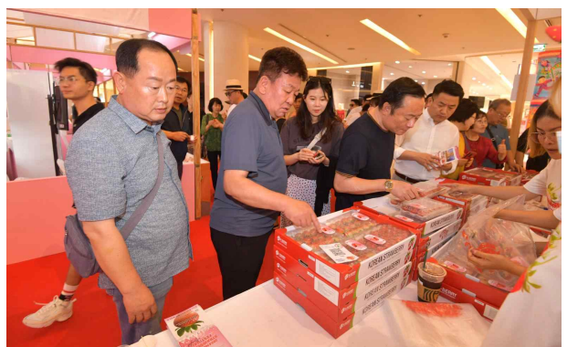
▲ 농식품 해외박람회 딸기판매장 방문