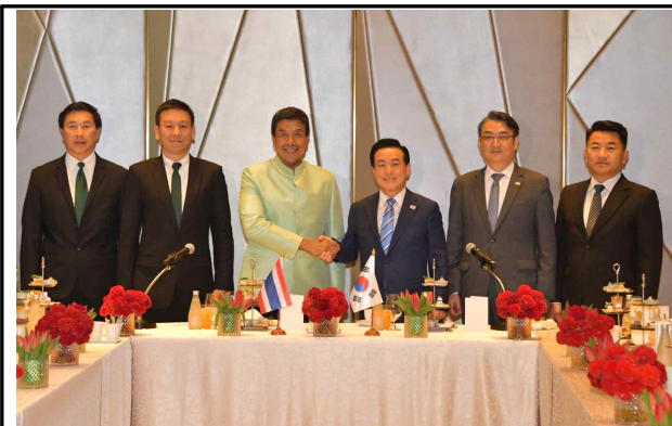
▲ 논산시-방콕시 친선교류 행사