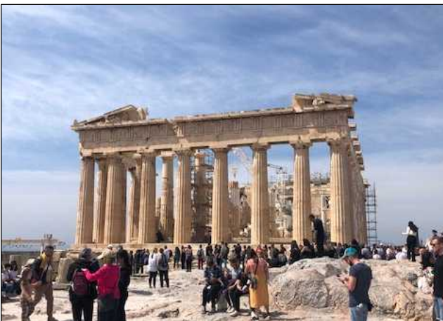
< 그리스, 복원·관람을 병행 활용 >