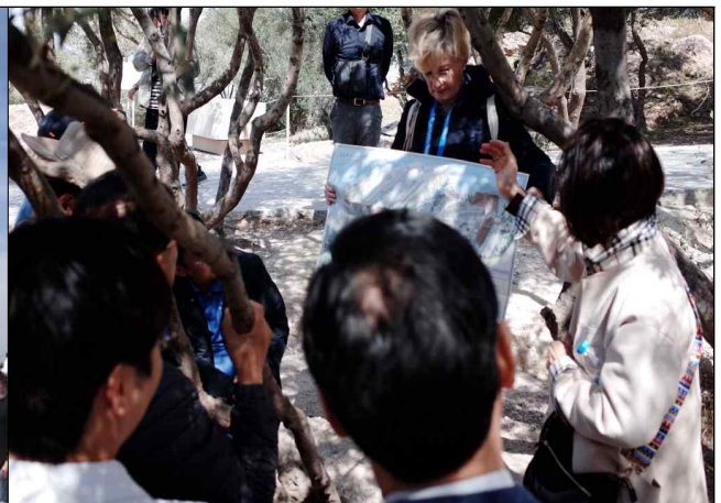
< 아크로폴리스 복원 사례 청취 >