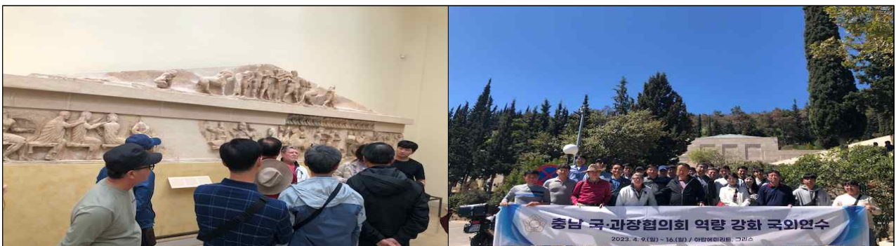
< 유적 발굴 내용 청취 >

덧붙여 스토리텔링에 기반한 문화콘텐츠 개발과 자연관광지 연계가 필요하다. 단순히 1, 2개소를 관람하는 것이 아닌, 자연과 문화가 연계한 관광상품을 개발하여 당일 관람이 아닌, 최소 1박 이상을 머무를 수 있는 관광상품을 개발하여 경제적 파급효과가 커질 수 있도록 노력해야 한다. 최근 조성된 한옥마을, 강경 근대호텔 등 관광객에게 매력을 어필할 수 있는 공간이 다수 조성되어야 하는 이유일 것이다.