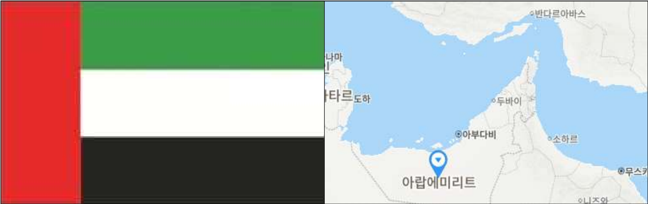
< UAE 국기 >