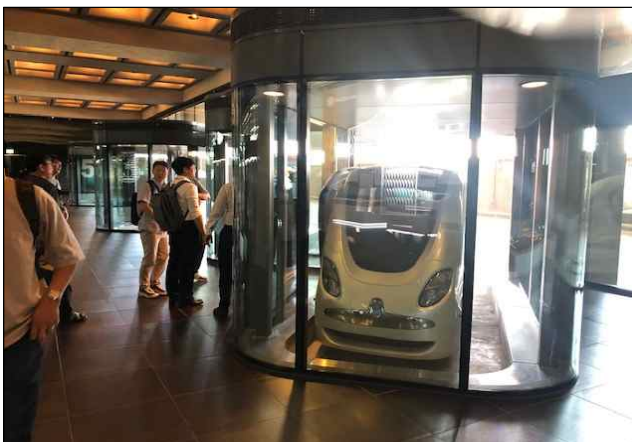
< 도시내 자율주행 차량(RPT) >

2006년도부터 지금까지 아랍에미리트에서 실제로 투자된 금액은 20조원 정도이며, 아직까지는 100% 지속가능한 에너지로 전환된 도시는 아니다. 2030년까지 100% 재생가능한 에너지로만 도시를 운영할 수 있도록 노력하고 있다.