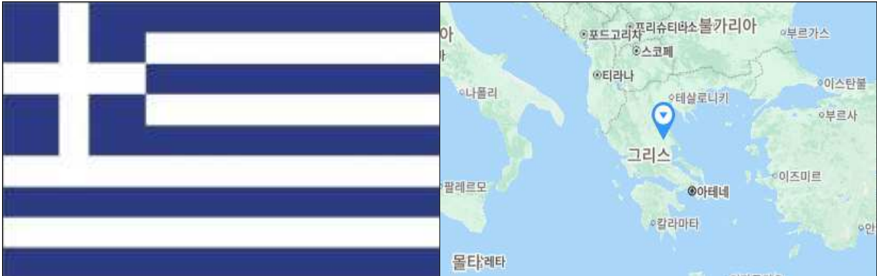
< 그리스 국기 >