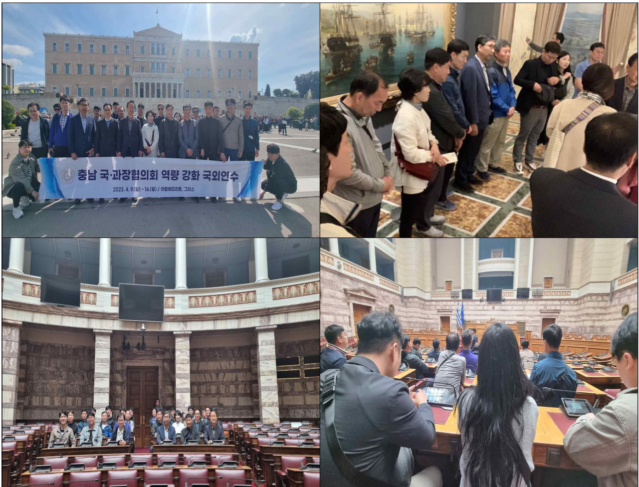
그리스 의회 방문사진

덧붙여 정책지원관은 "의정활동 지원"의 업무를 부여받게 되는데, 의정활동 지원이라는 내용이 불명확하여 혼란을 초래하고 있다. 명확한 규정을 제정하는 것이 필요한 상황이다. 업무경계를 명확히 하여 지방의원의 사적용무 수행, 갑질 등에 피해가 발생하지 않도록 제도적 정비가 필요한 이유이다.