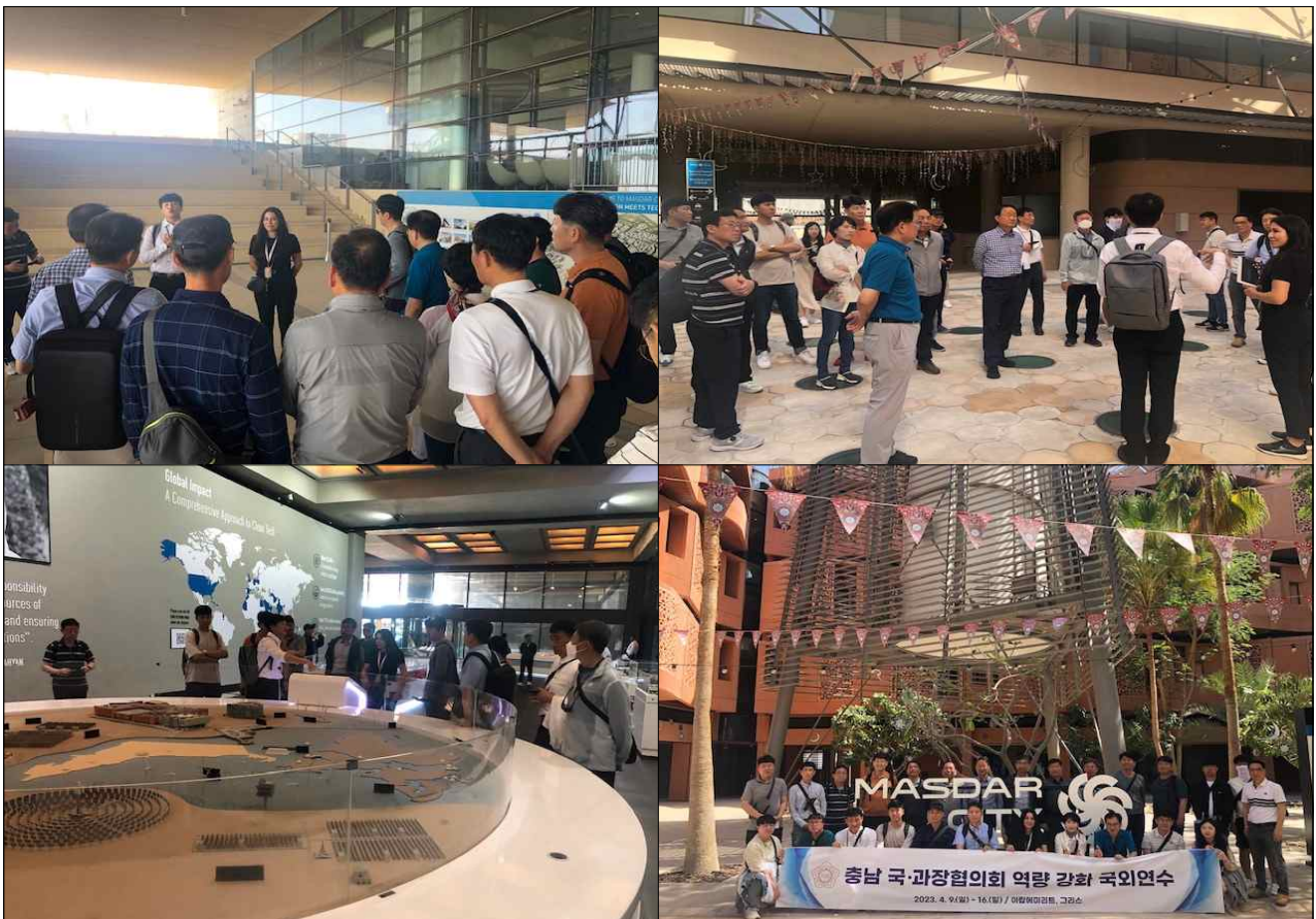
마스다르 시티 방문 사진

환경 문제는 단순히 지자체가 관할하는 지역만의 문제가 아니기에 효율적인 사업 추진을 위하여 지자체 간의 협력이 중요하다. 한국을 대표하는 탄소 중립 경제와 기후변화 대응을 선도하는 지역으로 자리 잡을 수 있을 수 있도록 일종의 협의체 구성 등을 통한 탄소 중립 사업 발굴, 우수사례 공유 및 이행 분위기 확산을 위한 지자체 간의 협력관계를 구축하는 것이 필요하다.