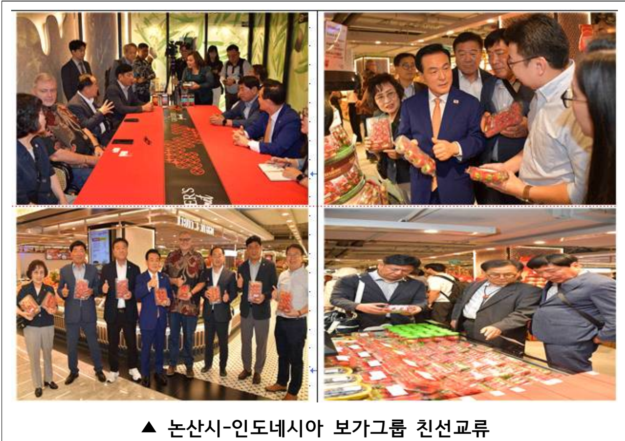
▲ 논산시-인도네시아 보가그룹 친선교류