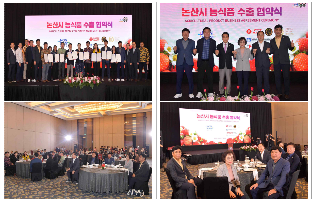
▲ 논산시 농식품 수출 업무 협약식