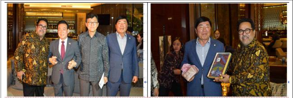
▲ 논산시-자카르타주 친선교류