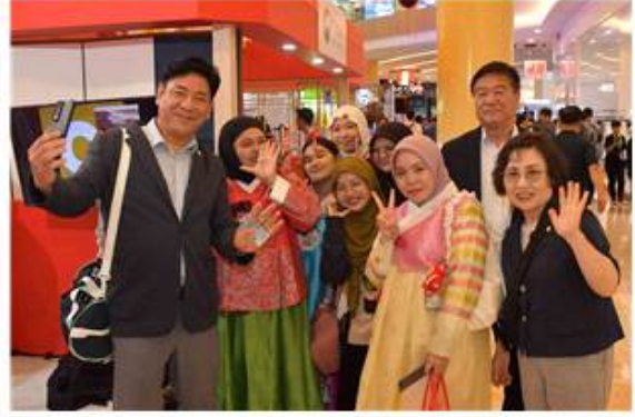
▲ 농식품 해외박람회 딸기판매장 및 홍보부스 방문