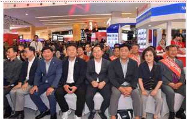
▲ 논산시 농식품 해외박람회 개막식 참석