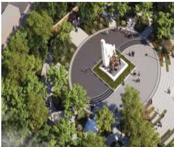
▶ 조형물 이설(문화공간 조성)