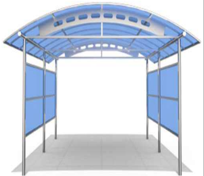
▶ 빗물 유입 방지를 위한 비가림 시설 설치