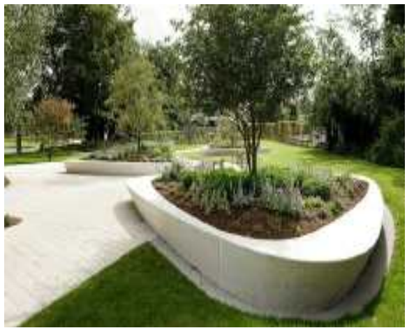
▶ 시민운동장 입구 녹지공원 조성