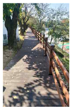
▶ 시민공원과 연계한 보행환경 조성