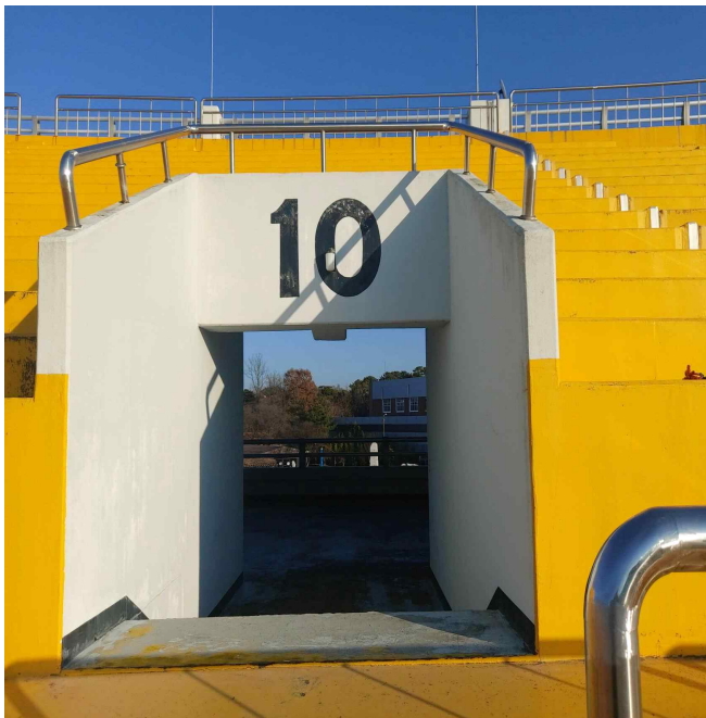
▶ 시민운동장 개방형 출입구 상부 빗물 유입