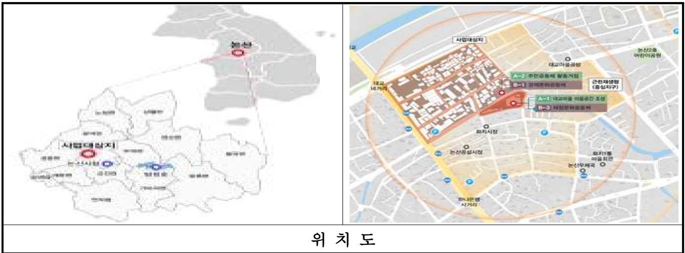
위 치 도