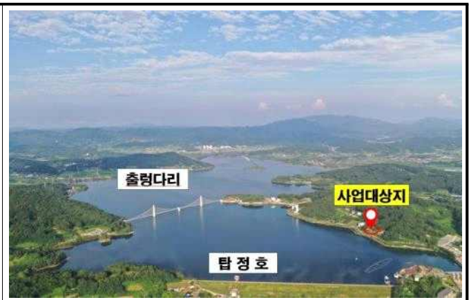
위 치 도