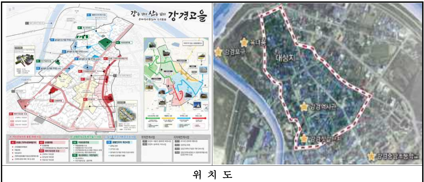
위 치 도