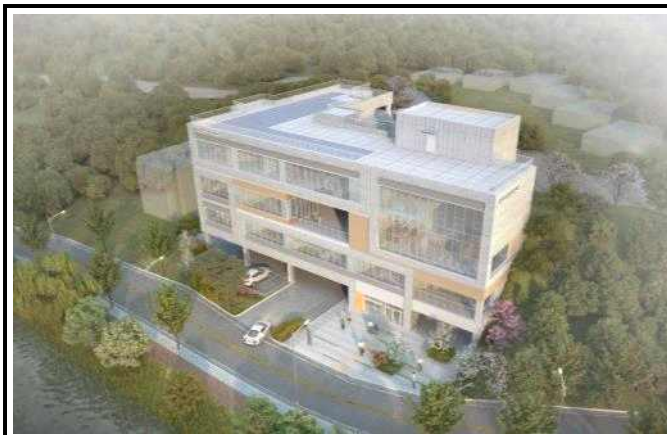
조 감 도