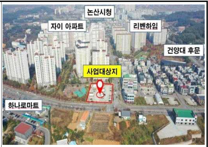
위 치 도