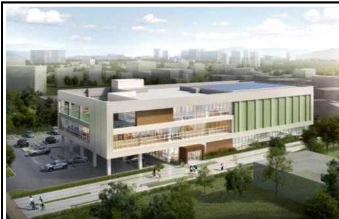
조 감 도