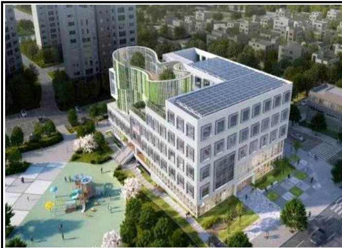
조 감 도