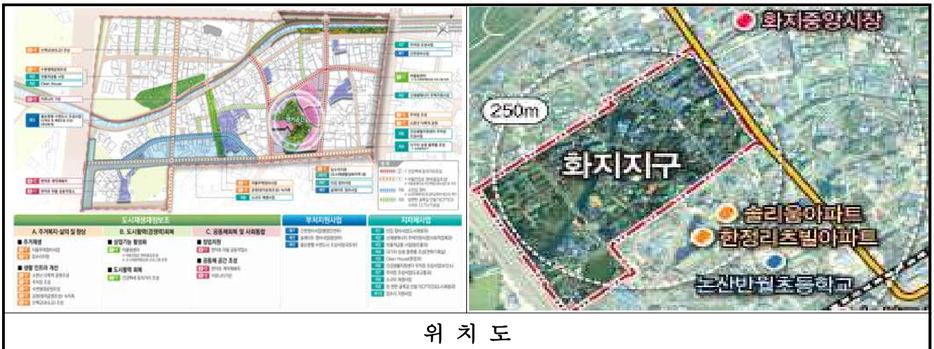
위 치 도