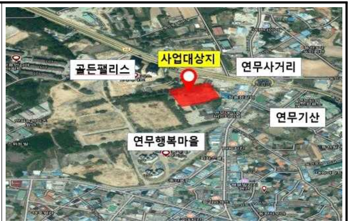
위 치 도