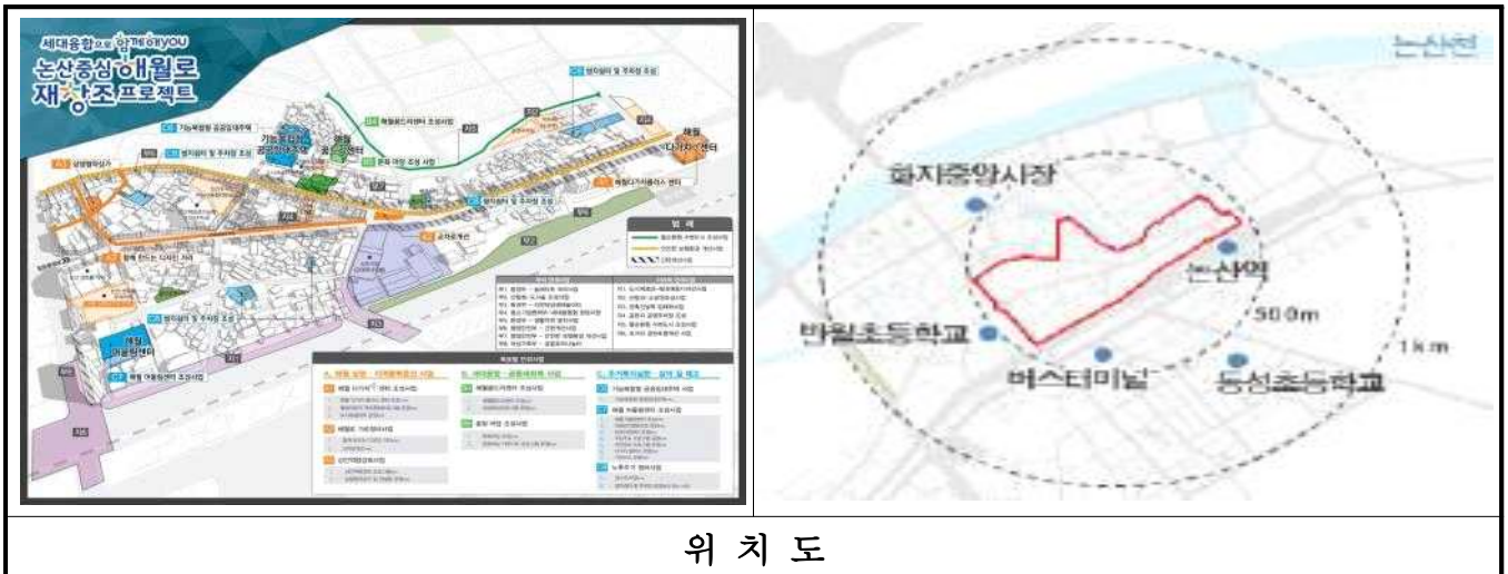
위 치 도