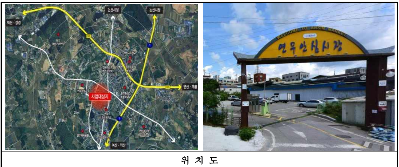
위 치 도